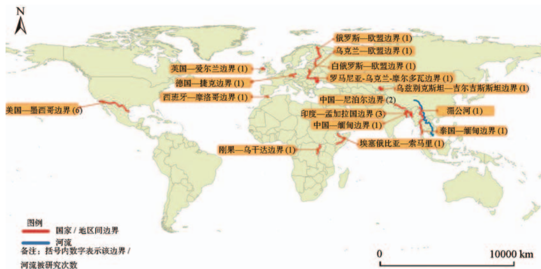
图2 2005-2015年《Political Geography》载文研究对象(线)分布

Fig. 1 Distribution of research subjects of papers in Political Geography in 2005-2015